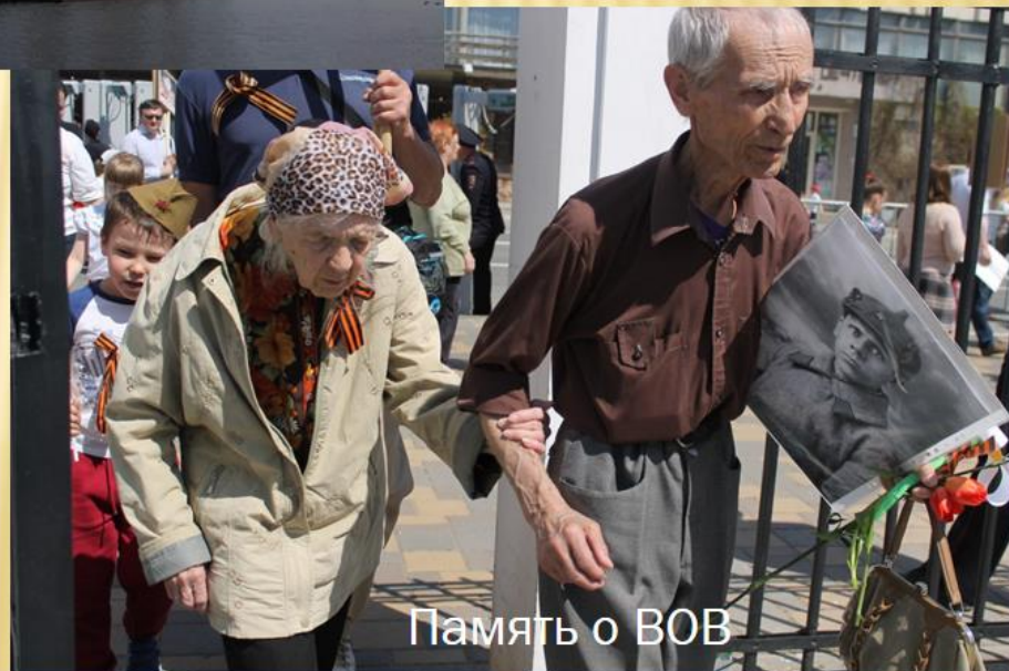
Память о ВОВ

ФИ, лет автору, название работы ;(№ в серии), город, название студии ; для фотоистории - небольшое эссе.